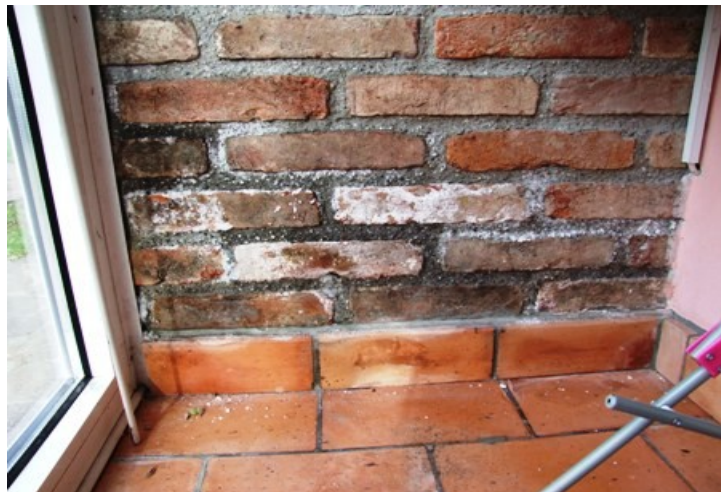
IMMAGINE DOPO 3 TRATTAMENTI IGRODRY